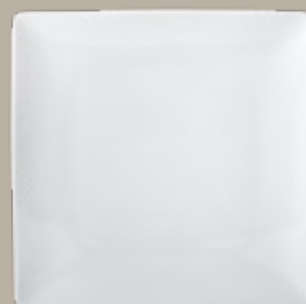
PLATO TRINCHE CUADRADO

26 cm (10") Código 322906 29 cm (11") Código 322905