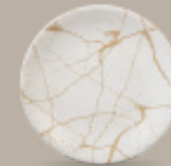
PLATO REGINA 19 cm (7.5") Código 322613