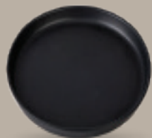
PLATO GOURMET 24 cm (9,4") Código 321663