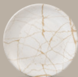
PLATO REGINA 28 cm (11") Código 322611