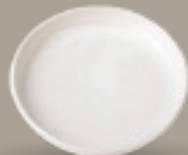
PLATO GOURMET 20 cm (7,9") Código 321660