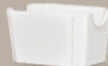
AZUCARERA P/SOBRES n/a Código 309060