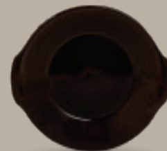
PLATO CACEROLA 23 cm (9") Código 322631