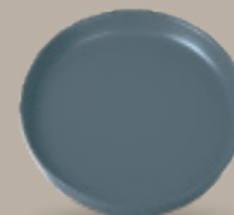
PLATO GOURMET 24 cm (9,4") Código 323249