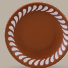
PLATO TRINCHE 23 cm (9") Código 321823