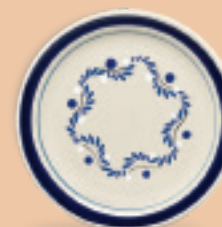
PLATO PASTEL 19 cm (7 7/8") Código 317267