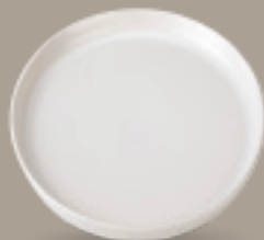
PLATO GOURMET 26 cm (10,2") Código 321658