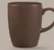
TARRO 310 mL (10.5 oz) Código 321339