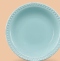
PLATO SOPERO 700 mL (24 oz) Código 317222