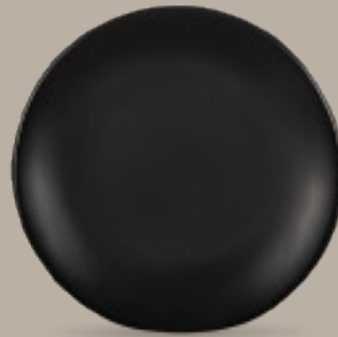
PLATO TRINCHE 28 cm (11") Código 319516 23 cm (9") Código 319515 19 cm (7 1/2") Código 319514