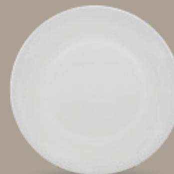
PLATO TRINCHE 28 cm (11") Código 320136 23 cm (9") Código 320137 19 cm (7 1/2") Código 320138