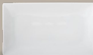
PLATO TRINCHE RECTANGULAR