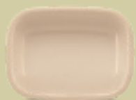
PLATÓN CUADRILONGO 25 cm (10") Código 35994