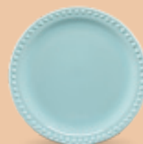
PLATO PASTEL 19 cm (7 1/2") Código 317223