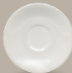
PLATO MOKA 12 cm (4 5/7") Código 309050