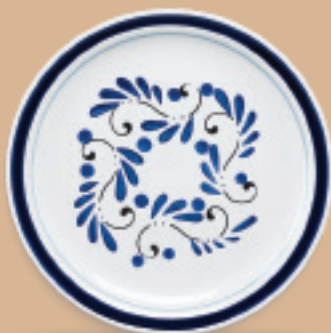
PLATO TRINCHE 27 cm (10 5/8") Código 317275