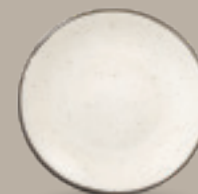
PLATO REGINA 19 cm (7.5") Código 322617