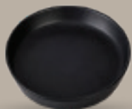
PLATO GOURMET 20 cm (7,9") Código 321659