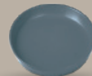
PLATO GOURMET 20 cm (7,9") Código 323250