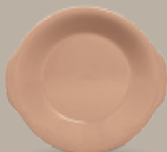
PLATO CACEROLA 23 cm (9") Código 322579