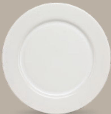
PLATO BASE 32 cm (12 3/5") Código 309052