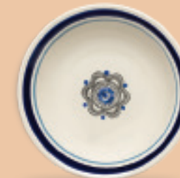
PLATO SOPERO 700 mL (24 oz) Código 317266