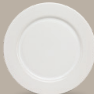
PLATO TRINCHE 28 cm (11") Código 310021 26 cm (10 1/4") Código 309040 23 cm (9") Código 309041 19 cm (7 1/2") Código 309042 16 cm (6 2/7") Código 309043