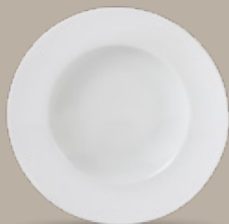
PLATO PASTA BOWL 21 cm (8") Código 322902 26 cm (10") Código 322903 30 cm (11") Código 322907