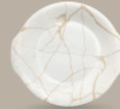
PLATO CACEROLA 23 cm (9") Código 322609