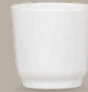
TAZA HUEVO 200 mL (7 oz) Código 312818