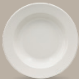
PLATO SOPERO 23 cm (9") 300 mL (10 oz) Código 309044