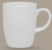
TARRO 310 mL (10.5 oz) Código 320142