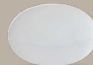
PLATO TRINCHE OVALADO

21 cm (8") Código 322904 26 cm (10") Código 322915 30 cm (11") Código 322909