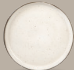
PLATO GOURMET 26 cm (10.2") Código 322616