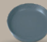
PLATO GOURMET 18 cm (7") Código 323251