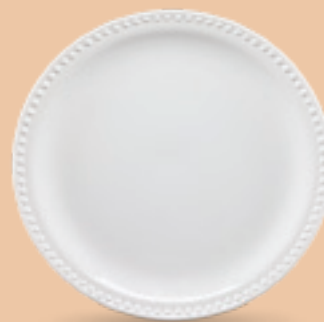
PLATO TRINCHE 27 cm (10 5/8") Código 317066