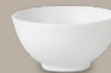
TAZÓN DE ARROZ REDONDO

12 cm (4 3/4") Código 322917 15 cm (6") Código 322917