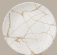
PLATO REGINA 23 cm (9") Código 322612