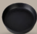
PLATO GOURMET 18 cm (7") Código 321664