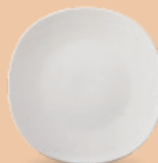
PLATO PASTEL 19 cm (7 1/2") Código 308191