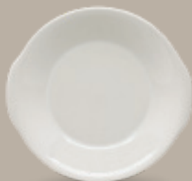
PLATO CACEROLA 23 cm (9") Código 309045