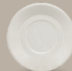
PLATO CAFÉ 16 cm (6 2/7") Código 309049