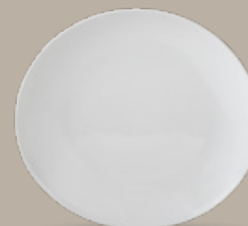
PLATO COUPE OVALDO