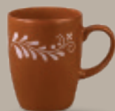
TARRO 310 mL (10.5 oz) Código 321825