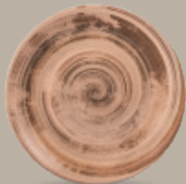
PLATO REGINA 28 cm (11") Código 322547