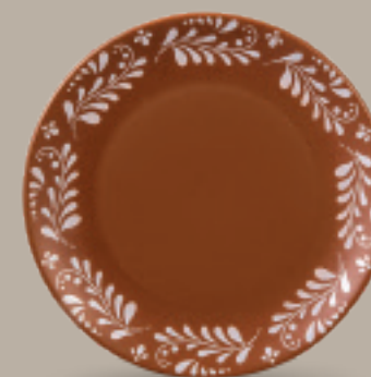
PLATO TRINCHE 28 cm (11") Código 321824