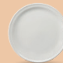
PLATO PASTEL 20 cm (7 7/8") Código 38519