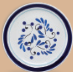
PLATO PASTEL 19 cm (7 7/8") Código 317277