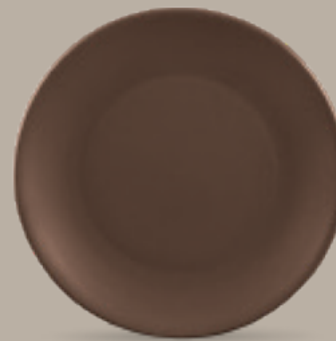
PLATO TRINCHE 28 cm (11") Código 321136 23 cm (9") Código 321137 19 cm (7 1/2") Código 321138