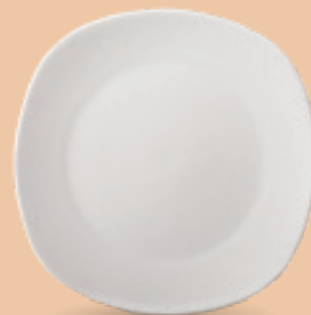
PLATO TRINCHE 25 cm (9 5/6") Código 308189