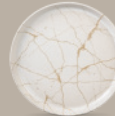
PLATO GOURMET 26 cm (10.2") Código 322610