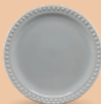
PLATO PASTEL 19 cm (7 1/2") Código 317213