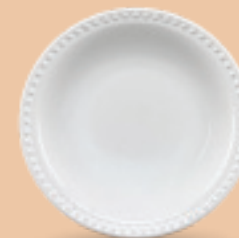
PLATO SOPERO 700 mL (24 oz) Código 317067