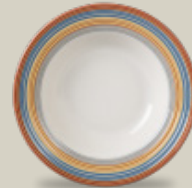
PLATO SOPERO 380 mL (13.5 oz) Código 323306