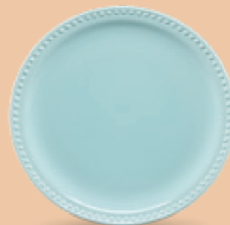
PLATO TRINCHE 27 cm (10 5/8") Código 317221