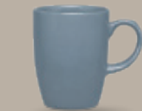
TARRO 310 mL (10.5 oz) Código 319153