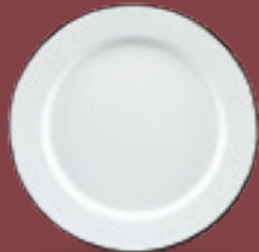
PLATO TRINCHE CON ALA