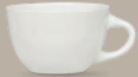
TAZA CLÁSICA 220 mL (7.5 oz) Código 309053