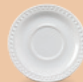
PLATO P/ TAZA 16 cm (6 2/7") Código 317069