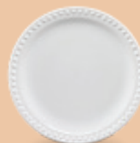
PLATO PASTEL 19 cm (7 1/2") Código 317068