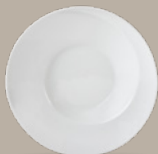
PLATO PASTA REDONDO

26 cm (10") Código 322906 29 cm (11") Código 322905