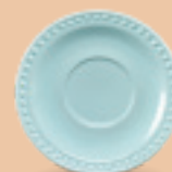
PLATO P/ TAZA 16 cm (6 2/7") Código 317224