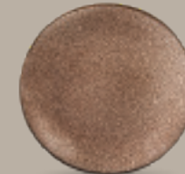
PLATO REGINA 19 cm (7.5") Código 322620