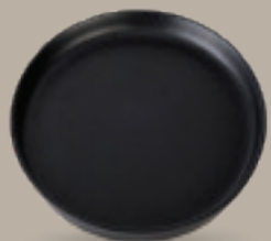
PLATO GOURMET 26 cm (10,2") Código 321657