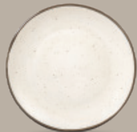
PLATO REGINA 28 cm (11") Código 322619