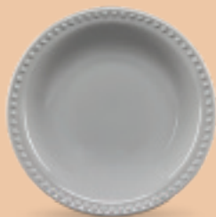
PLATO SOPERO 700 mL (24 oz) Código 317212