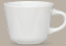
TAZA SANTA ANITA 210 mL (7 oz) Código 312812