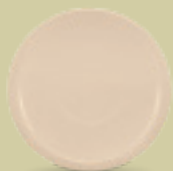
PLATO P/TAZA 13.7 cm (5.4") Código 35990