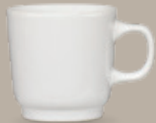
TAZA MUG 290 mL (10 oz) Código 309054