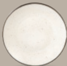
PLATO REGINA 23 cm (9") Código 322618