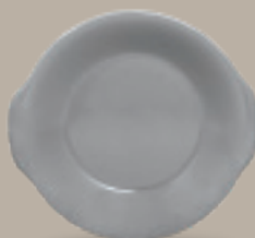
PLATO CACEROLA 23 cm (9") Código 322614