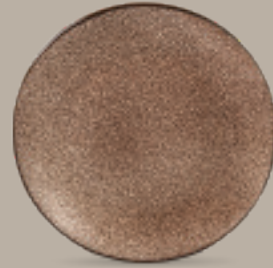
PLATO REGINA 28 cm (11") Código 322622