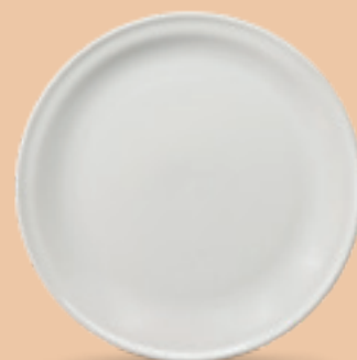
PLATO TINCHE 27 cm (10 5/8") Código 38515