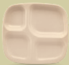
CHAROLA C/DIVISIÓN 28 cm (11") Código 35995