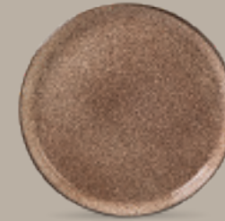
PLATO GOURMET 26 cm (10.2") Código 322624