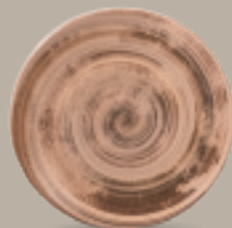
PLATO REGINA 23 cm (9") Código 322546