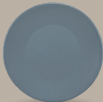
PLATO TRINCHE 28 cm (11") Código 319158 23 cm (9") Código 319157 19 cm (7 1/2") Código 319156