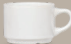
TAZA EMBROCABLE 190 mL (6.5 oz) Código 309057