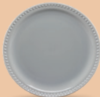
PLATO TRINCHE 27 cm (10 5/8") Código 317211