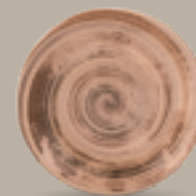
PLATO REGINA 19 cm (7.5") Código 322545