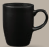
TARRO 310 mL (10.5 oz) Código 319518