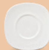
PLATO PARA TAZA 15 cm (6") Código 308192