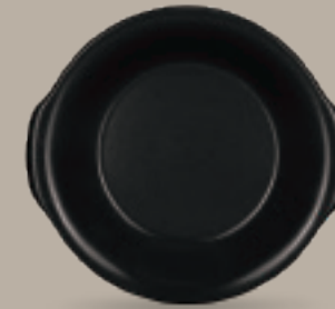
PLATO CASEROLA 23 cm (9") Código 319517