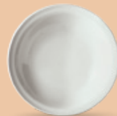
PLATO SOPERO 700 mL (24 oz) Código 3851