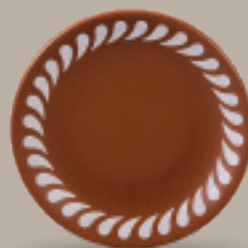
PLATO TRINCHE 19 cm (9") Código 321823