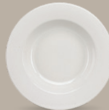
PLATO PASTA BOWL 31 cm (12 1/5") Código 310089