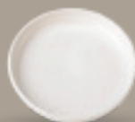
PLATO GOURMET 18 cm (7") Código 321666