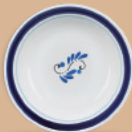
PLATO SOPERO 700 mL (24 oz) Código 317276