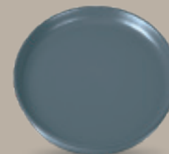
PLATO GOURMET 26 cm (10,2") Código 323248