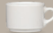
TAZA MOKA 90 mL (3 oz) Código 309055