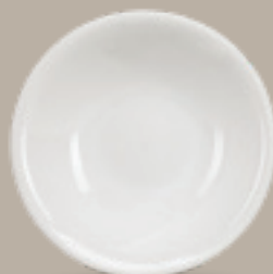
PLATO COMPOTA 230 mL (8 oz) Código 309046