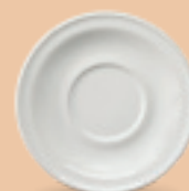
PLATO P/ TAZA 16 cm (6 2/7") Código 38520