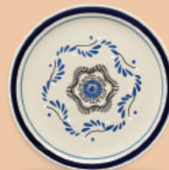
PLATO TRINCHE 27 cm (10 5/8") Código 317265