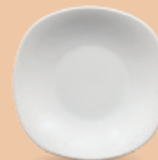
PLATO SOPERO 610 mL (21 oz) Código 308190